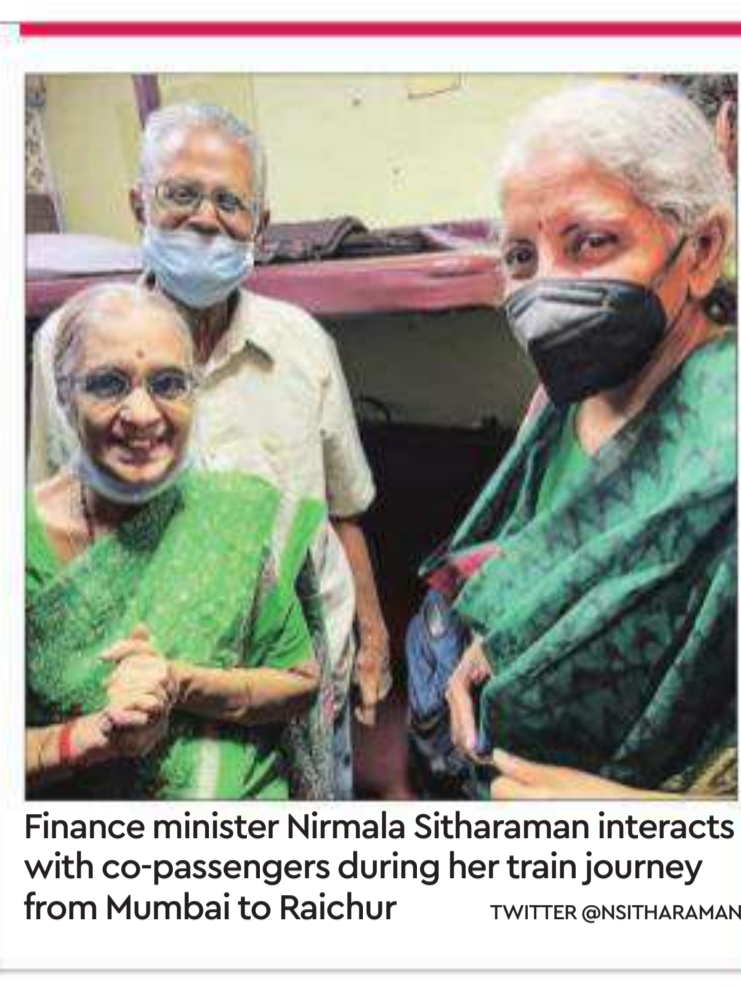
Finance minister Nirmala Sitharaman interacts with co-passengers during her train journey from Mumbai to Raichur

Millet conclave 2022 is being organised as a curtain raiser prior to the International Year of Millet 2023. The millets farmer producers associations (FPOs), processors and startups are participating in the two-day conclave 2022 being organised jointly by Atal Innovation Mission, UAS and NABARD.