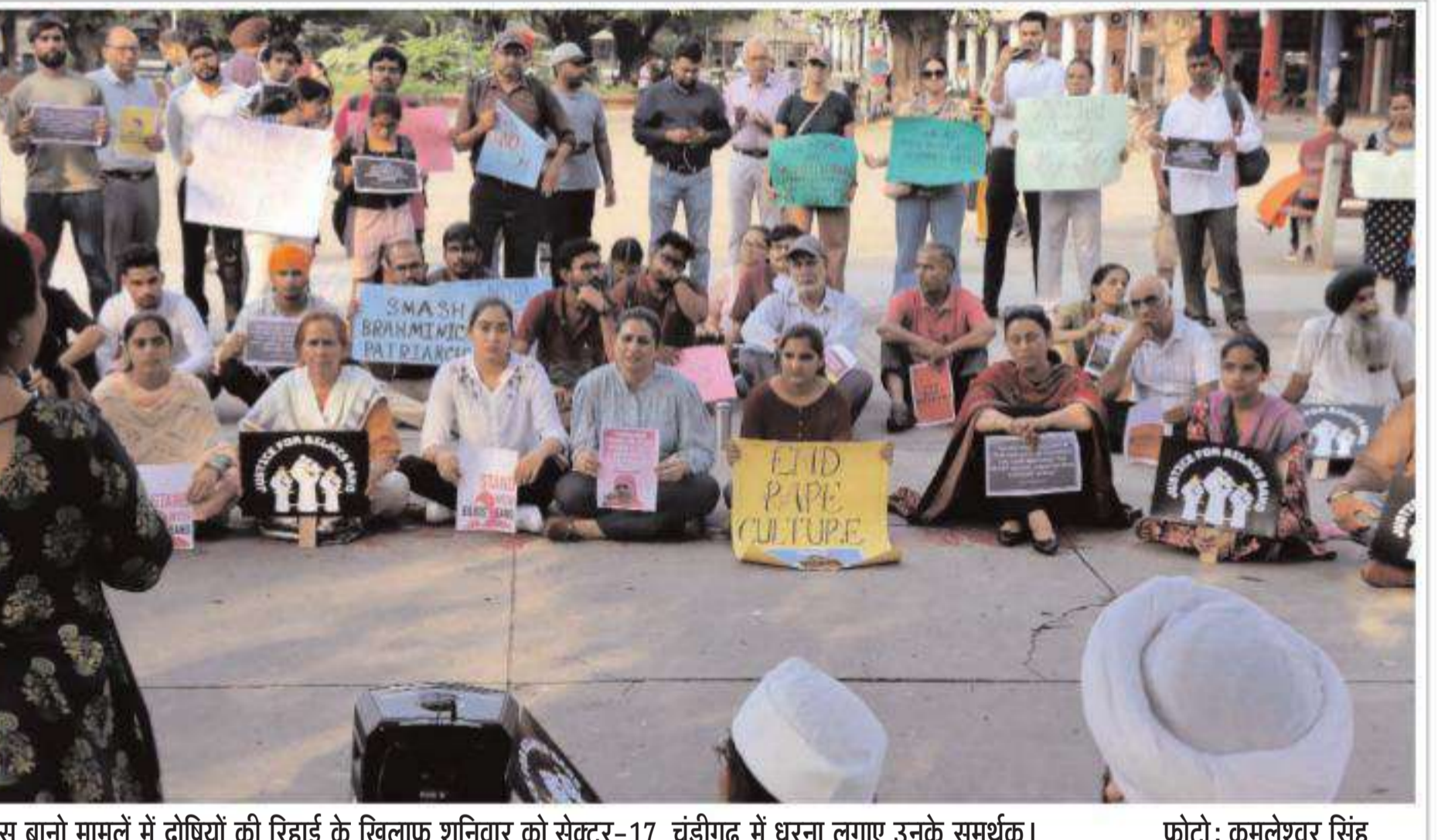
बिलकिस बानो मामले में दोषियों की रिहाई के खिलाफ शनिवार को सेक्टर-17, चंडीगढ़ में धरना लगाए उनके समर्थक।

पंजाब नेशनल बैंक की भाम शाखा में सहायक प्रबंधक जसवीर सिंह ने इस बारे में बताया कि यह वारदात तड़के करीब 2.40 बजे हुई थी जिसमें कार में आए चोर अपने साथ करीब 17 लाख रुपए लूटकर फरार हो गए। पुलिस का कहना है कि चोरों की असल संख्या का अभी पता नहीं चल पाया।