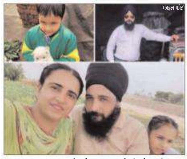
आम आत्महत्याओं से अलग होती हैं। मीडिया, टीवी चैनलों, पुस्तकों, अखबारों के जरिये जागरूकता मुहिम चलाकर इनकी पुनरावृत्ति रोकना जरूरी है।